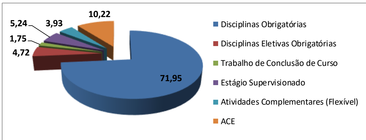
Figura 2. Distribuição percentual dos componentes curriculares do curso de Engenharia de Energia.